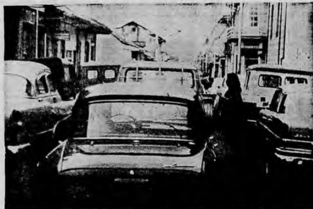
LOS PEATONES.—La presente gráfica muestra cómo la imprudencia o prisa de algunas personas, las hace exponerse a serios accidentes de la circulación. Una dama atraviesa la vía mientras buses y automóviles a gran velocidad la circundan por tres frentes, atrás; adelante y derecha.