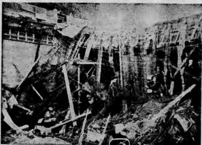
Conforme se aprecia en la gráfica toda la armazón del taller Los Platados frente a los cementerios de esta capital, se vino al suelo cuando estaban realizando la chorrera, cayendo sobre cantidad de trabajadores que laboraban en la planta baja. (Foto Araya).