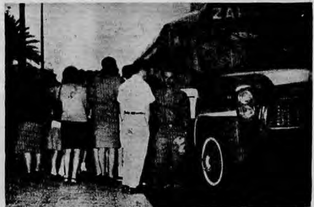
EN LAS HORAS "PICO".—Una de las tantas terminales de buses de esta capital con la natural aglomeración de público tratando de entrar a los incómodos buses que para como de males, en gran porcentaje sólo tienen una puerta.