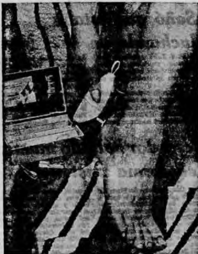
Una pequeña unidad, que funciona con batería y que tiene el tamaño de un radio de transistores, ayuda a eliminar las asperezas de los pies.

Con la unidad se suministran también una crema y un pulido.