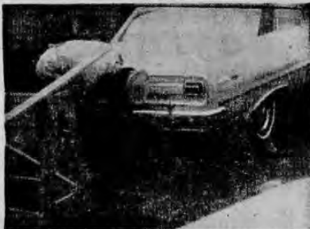
EL "QUITAPLACAS" — Entra en acción a cualquier hora y en cualquier parte. Aquí uno de estos necios funcionarios públicos, que tantos entratiempos causan a los propietarios de vehículos, quienes luego tienen que llegar a la Guardia de Tránsito a recoger las placas que les han quitado bajo el menor pretexto. Lo peor no es eso, sino que en más de un caso no aparecen y entonces el problema ya es dinero o más pérdida de tiempo. (Foto Araya).